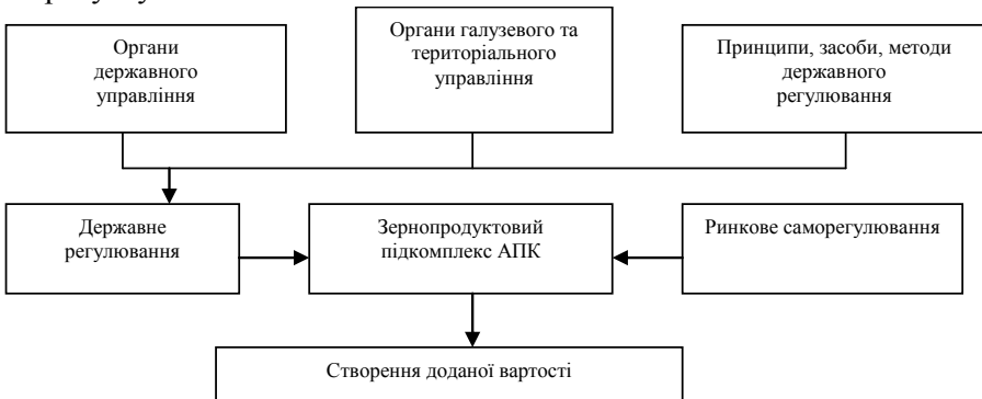
Рис. 1. Роль і місце державного регулювання в процесі формування доданої вартості у зернопродуктовому підкомплексі АПК (складено за власними дослідженнями)

Роль і місце державного регулювання в процесі формування доданої вартості у зернопродуктовому підкомплексі АПК розглянемо на рисунку 1.