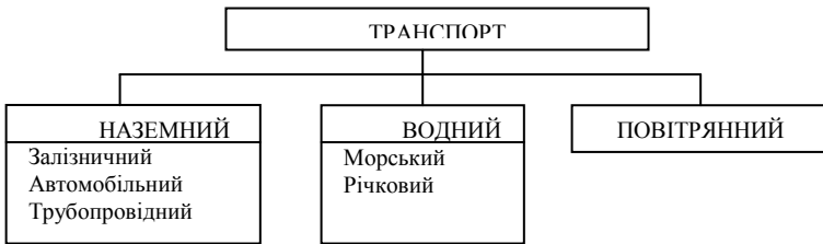
Рис. 1. Види транспорту

послуги за всіма видами транспорту. Загалом виділяють такі види транспорту (рис. 1).