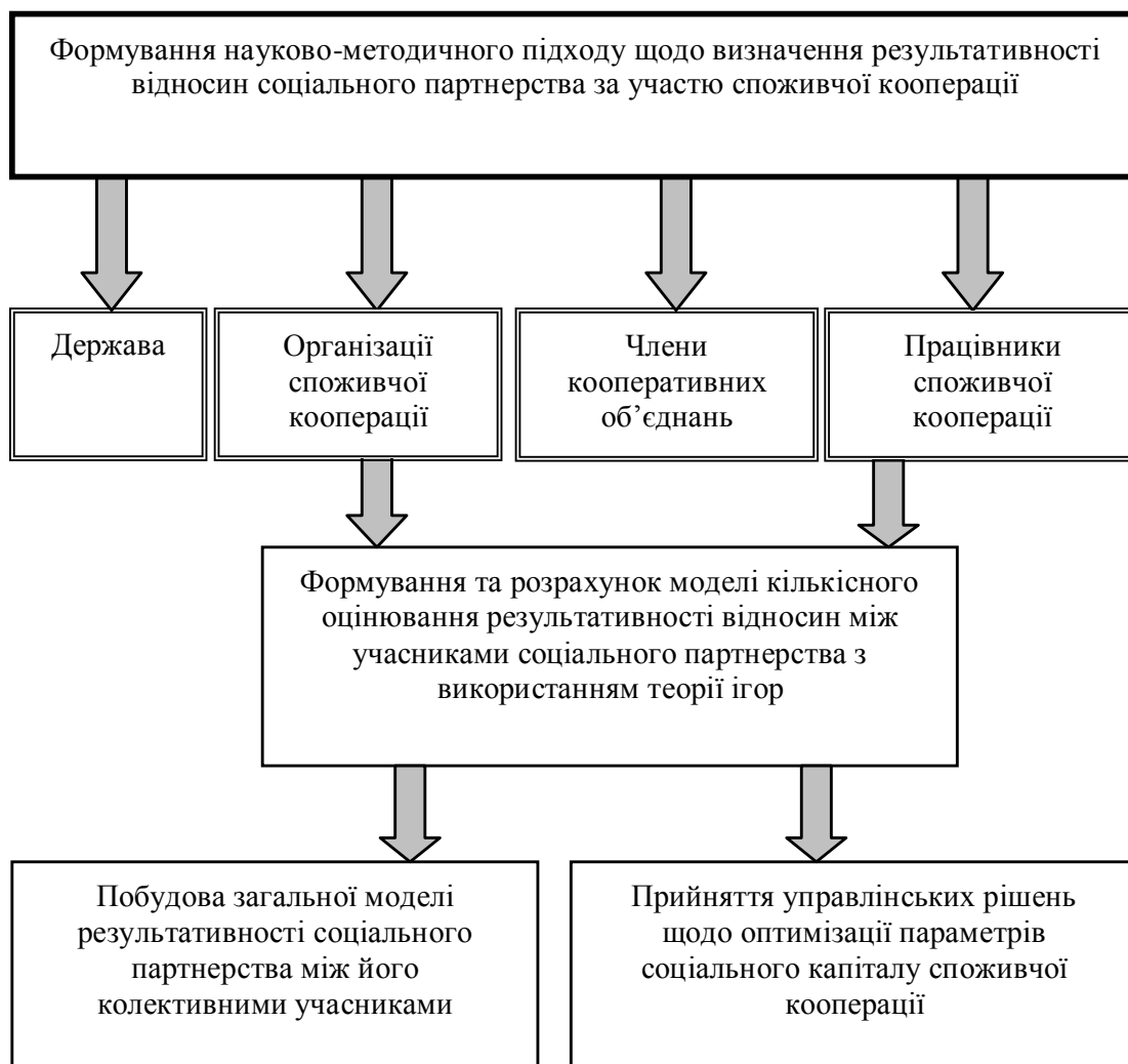
Рис. 2. Етапи визначення результативності функціонування соціального партнерства за участю держави, працівників споживчої кооперації, членів кооперативних об'єднань та організацій споживчої кооперації (побудовано автором)

є типовою у практичній діяльності менеджерів, маркетологів, спеціалістів рекламних служб, які щоденно приймають рішення за умов гострої конкуренції, неповноти інформації тощо [4, с.216-223]. Така ж гра можлива і в системі споживчої кооперації, якщо розглядати гру для наступних пар-учасників: 1) наймані працівники, роботодавці; 2) члени кооперативних об'єднань, держава.