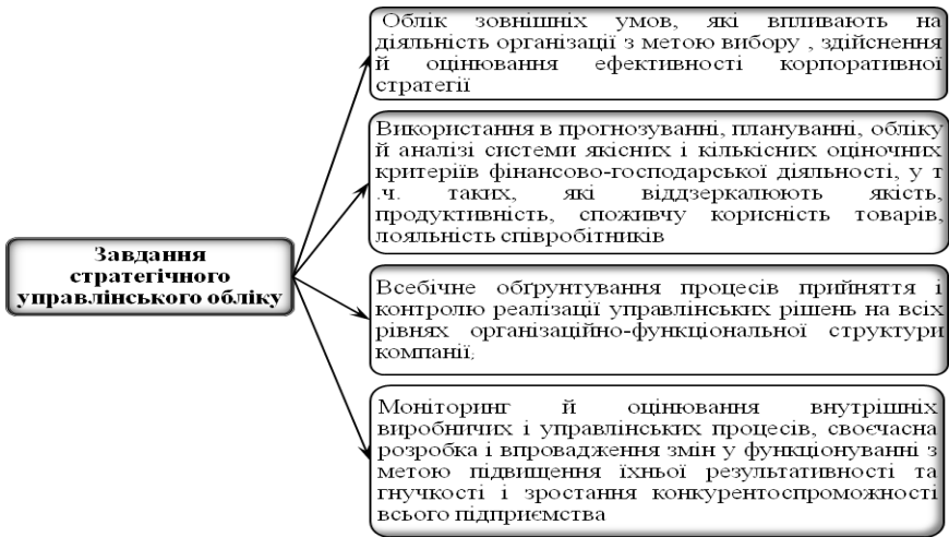
Рис. 1. Схематичне відображення завдань стратегічного управлінського обліку

Науковцями, виходячи з основної мети стратегічного управлінського обліку, сформовано сновні його завдання [3; 11; 17] (рис. 1).