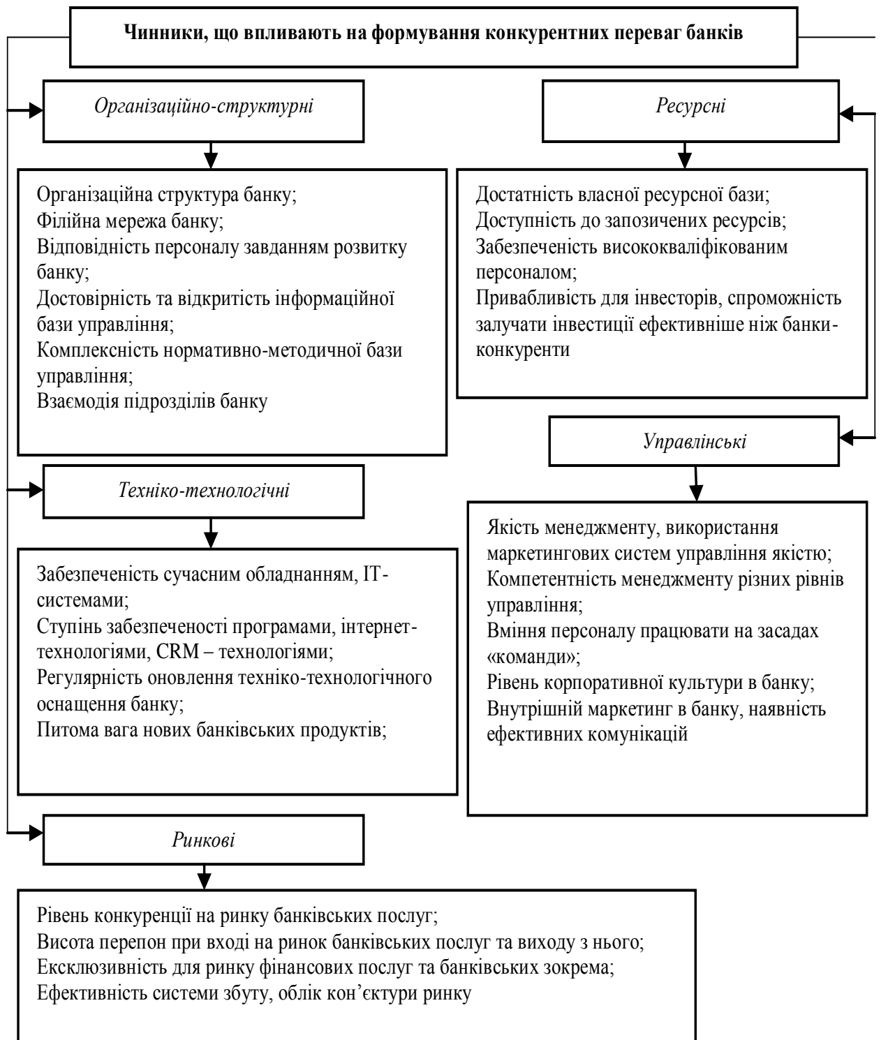
Рис. 1. Систематизація чинників, що формують конкурентні переваги сучасного банку (систематизовано автором)

В першу чергу це стосується вимог до виконання показника адекватності регулятивного показника банків (рис. 2).