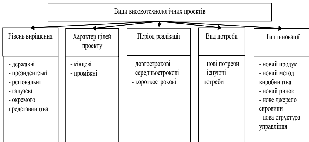
Рис.2. Класифікація високотехнологічних проектів [6]

Враховуючи, що високотехнологічний проект націлений на реалізацію інновації (нововведення), що володіє певними характеристиками, подібна класифікація не має сенсу, так як проміжні проекти, спрямовані на проміжні результати, просто не є високотехнологічними проектами. Крім того, необхідно також відзначити, що пропонована вище класифікація високотехнологічних проектів по типу інновації безсумнівно важлива, проте вищевказаний варіант диференціації високотехнологічних проектів далеко не однозначний, тому що існує безліч різних підходів до угруповання самих інновацій за різними ознаками. Так, наприклад, в тому ж джерелі інновації поділяються за 7 ознаками (при цьому відсутній варіант, за яким класифікуються інноваційні проекти). В.І. Захарченко, М.М. Меркулов, Л.В. Ширяєва поділяють інновації по 9 ознакам [5], Р.А.Фатхутдінов називає також 9 ознак диференціації інновацій [10], І.І. Мазур, В.Д. Шапіро пропонують поділяти інновації за двома ознаками [7], В.Г. Мединський по одному [8] і т.д.