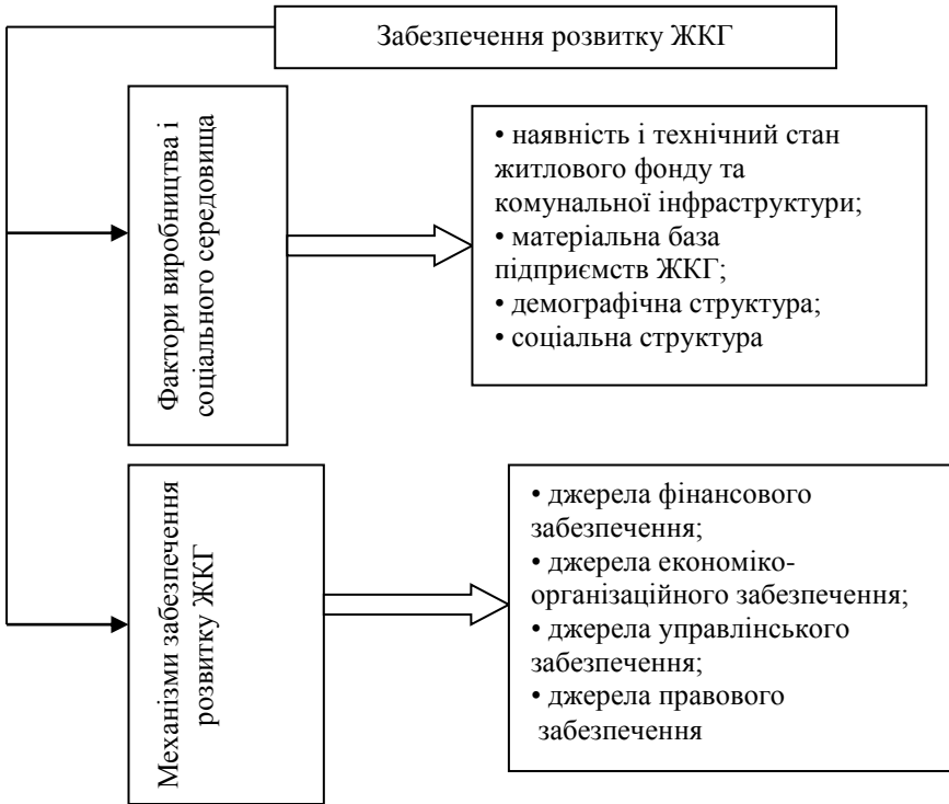
Рис. 1. Структура забезпечення розвитку житлово-комунального господарства міста

В умовах транзитивної економіки забезпечення ефективного функціонування ЖКГ стає одним з ключових аспектів. Поряд з цим, ситуація, що склалася в ЖКГ країни, викликає ряд негативних наслідків, перш за все невдоволення споживачів послуг галузі, що призводить появу значних сум неплатежів населення, борги бюджетних організацій і підприємств. Динаміка обсягів заборгованості населення з оплати житлово-комунальних послуг по регіонах України подана на рисунку 2.