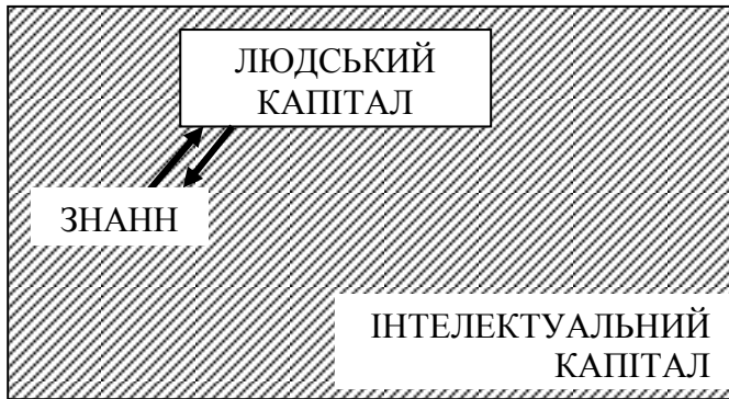
Рис. 2. Взаємозв'язок знань, людського та інтелектуального капіталів

І.Фішер, відкидаючи теорію трьох факторів виробництва, під капіталом розумів все те, що протягом певного часу спроможне приносити дохід. Базуючись на теорії корисності, він вводив людину до складу капіталу нарівні з іншими матеріальними об'єктами [13]. Теорія І.Фішера стала теоретичною основою розвитку альтернативних концепцій людського капіталу, згідно з якими до цього поняття відносять не лише знання та вміння людей, а й здатність до праці, психологічні особливості, суспільні і культурні якості людини. Подальші теоретичні розробки розглядали людський капітал як фактор відмінностей у заробітках, рівнях продуктивності праці. На пострадянському просторі концепція людського капіталу має важливе значення для вивчення комплексу питань ефективного функціонування ринку праці.