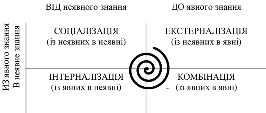
Рис. 3. Спіраль знань І. Нонака і Х. Такеучі [32]

Найбільш чітко пояснити прояв знань в контексті підприємства вдалося японським вченим І. Нонака і Х. Такеучі в своїй роботі «Компанія, що створює знання» [33]. Згідно з їхньою теорією, трансформація знань в організації ґрунтується на спіралі знань (Рис. 3).