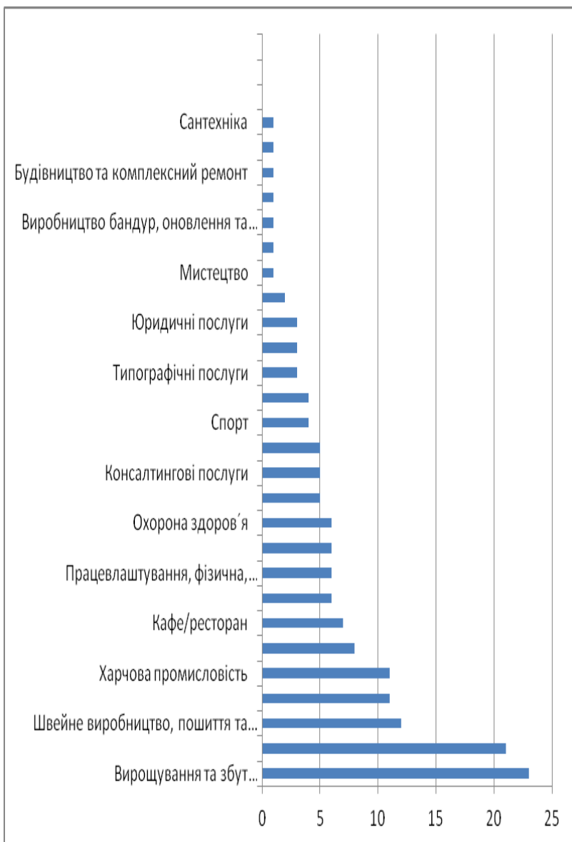
Рис.2. Зміст діяльності соціальних підприємств в Україні