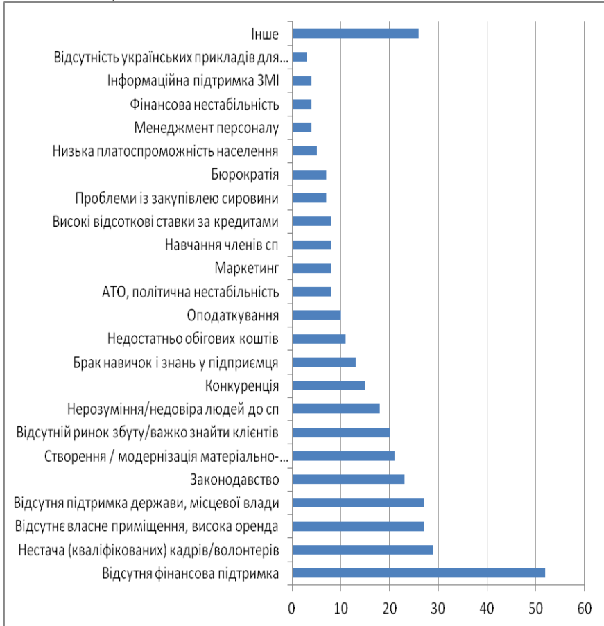
Рис. 3. Основні труднощі соціальних підприємств в Україні

На сьогоднішній день 23 соціальних підприємства зазначили про існування труднощів, які пов'язані із законодавством України. Сюди відноситься: недосконала законодавча база для діяльності соціальних підприємств, щодо малого та середнього бізнесу, часта зміна законодавства, заплутаність законодавства (зокрема, податкового).