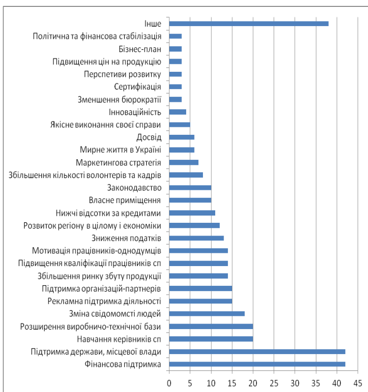
Рис. 4. Основні фактори, що сприятимуть розвитку соціальних підприємств

На першому місці опинилися два фактори: фінансова підтримка та підтримка держави, місцевої влади. Фінансова підтримка, згідно отриманих відповідей, це гранти, підтримка спонсорів для розширення діяльності соціального підприємства. Очікувана підтримка від держави чи місцевої влади має вигляд: створення сприятливої державної політики, програм підтримки розвитку соціальних підприємств, співпраця соціальних підприємств та представниками місцевої влади, розміщення державних замовлень, підтримка у наданні пільгових умов для оренди приміщення чи вирішення інших питань.