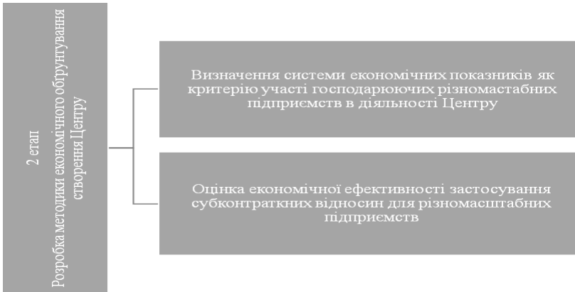
Рис.3. Другий етап створення Центру субконтрактації

Необхідний вибір організаційної структури Центру та джерел фінансування, впровадження нових інформаційно-комунікаційних технологій в організацію роботи Центру. Вибір варіанту організації Центру передбачає 2 варіанти – на базі Торгово-промислової палати або за рахунок пайових внесків.