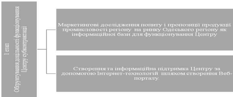
Рис.2. Перший етап створення Центру субконтракції

і потреби (замовленнях і пропозиціях) підприємств в єдину інформаційну систему субконтракції і промислового партнерства.