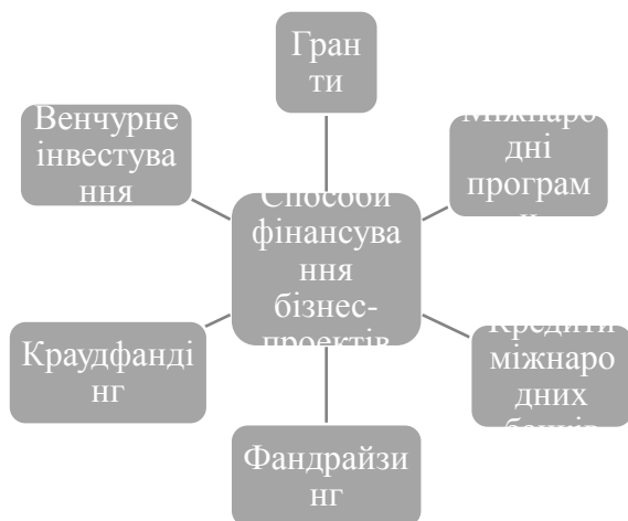
Рис. 1. Способи фінансування бізнес-проектів

Фінансування в рамках міжнародних програм, як правило, має форму співпраці держави з міжнародними фінансовими організаціями, націлену на реалізацію певних реформ в торгово-економічній сфері. Досить часто до їх проведення та імплементації залучаються компанії з приватного сектора [3].