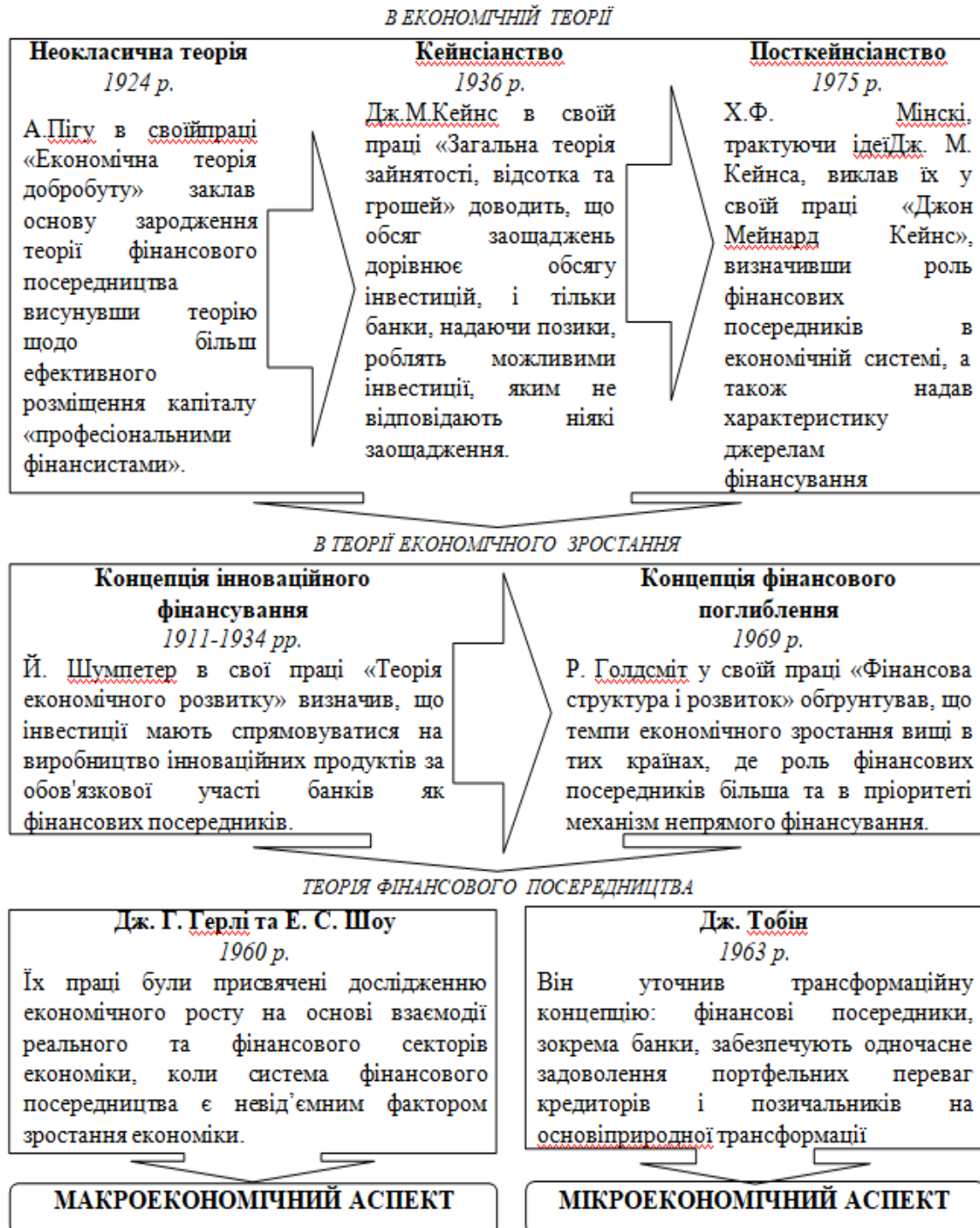
Рис. 2. Передумови формування та еволюції теорії фінансового посередництва

ційних) видах діяльності. Провідна роль у забезпечуванні нового поєднання факторів виробництва фінансовими ресурсами відводиться банкам, і відповідно роль фінансового посередництва полягає не стільки в забезпеченні кількісного приросту інвестицій, скільки в поліпшенні якості інвестицій. [9, С.168-169].