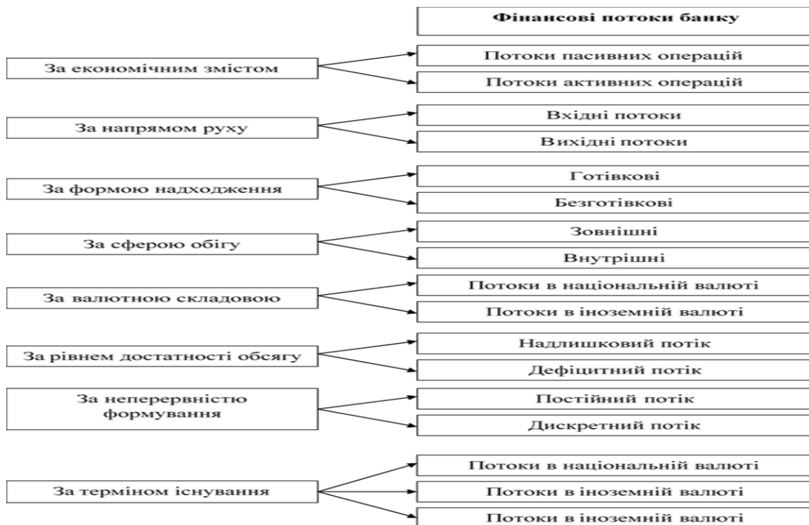
Рис. 1 Класифікація фінансових потоків банку

Фінансовий потік може бути приналежним до однієї конкретної із груп лише в певному проміжку часу, так як потік та його складові елементи переходять з однієї групи в іншу. Фінансовий потік має низку характеристик, які дозволяють його віднести до кількох класифікаційних груп в конкретний момент часу.