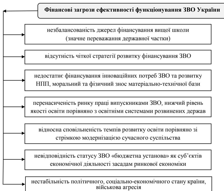
Рис. 2 Фінансові загрози ефективності функціонування ЗВО України