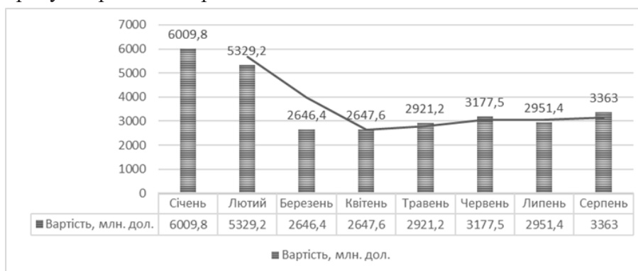
Рис. 2. Динаміка обсягів експорту агропродукції протягом січня-серпня 2022 р. млн. дол.

У грошовому виразі аготрейдери отримали майже 3,4 млрд. доларів виручки, що більш ніж на 410 млн. доларів більше, ніж у липні 2022 р. [7]. Наочно динаміка зростання експорту протягом 2022 року зображена на рис. 2.