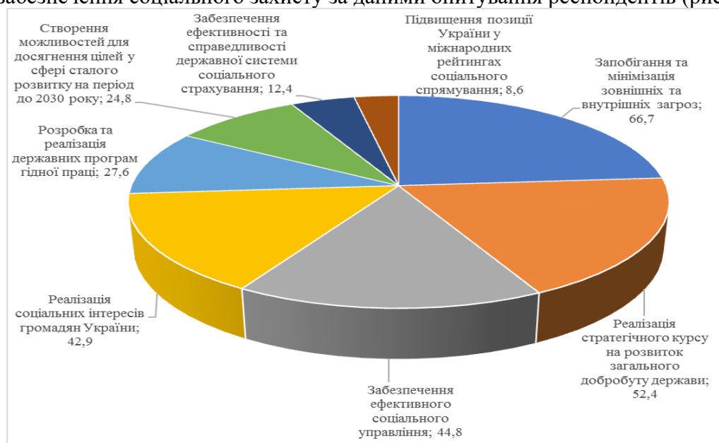
Рис. 2. Як держава має забезпечувати соціальний захист? (% респондентів)

На наш погляд, спочатку доцільно відзначити пріоритетні напрямки діяльності держави щодо забезпечення соціального захисту за даними опитування респондентів (рис. 2).