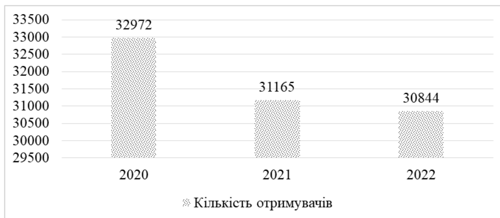
Рис. 2. Кількість отримувачів компенсацій та державних соціальних допомог в м. Кривий Ріг у 2020-2022 роках, осіб

У зв'язку зі змінами в законодавстві, а саме: посилення підтримки сімей з дітьми у 2021 році з'явився новий вид державної допомоги «натуральна допомога «пакунок малюка».