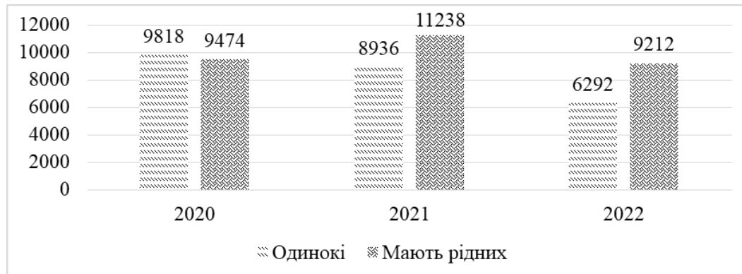
Рис. 4. Кількість отримувачів соціальних послуг в установах соціальної сфери у м. Кривий Ріг за 2020-2022 роки в залежності від наявності родичів, осіб

та соціальних послуг у м. Кривому Розі, можна зробити висновки, що беручи до уваги прийняті зміни в чинному законодавстві, кількість компенсацій, державних соціальних допомог за період до 24.02.2022 року та після дещо зменшилася. При цьому у 2022 році у зв'язку з повномасштабним вторгненням російської федерації та міграцією населення у більш безпечні регіони, також відбулося зменшення отримувачів соціальних допомог.