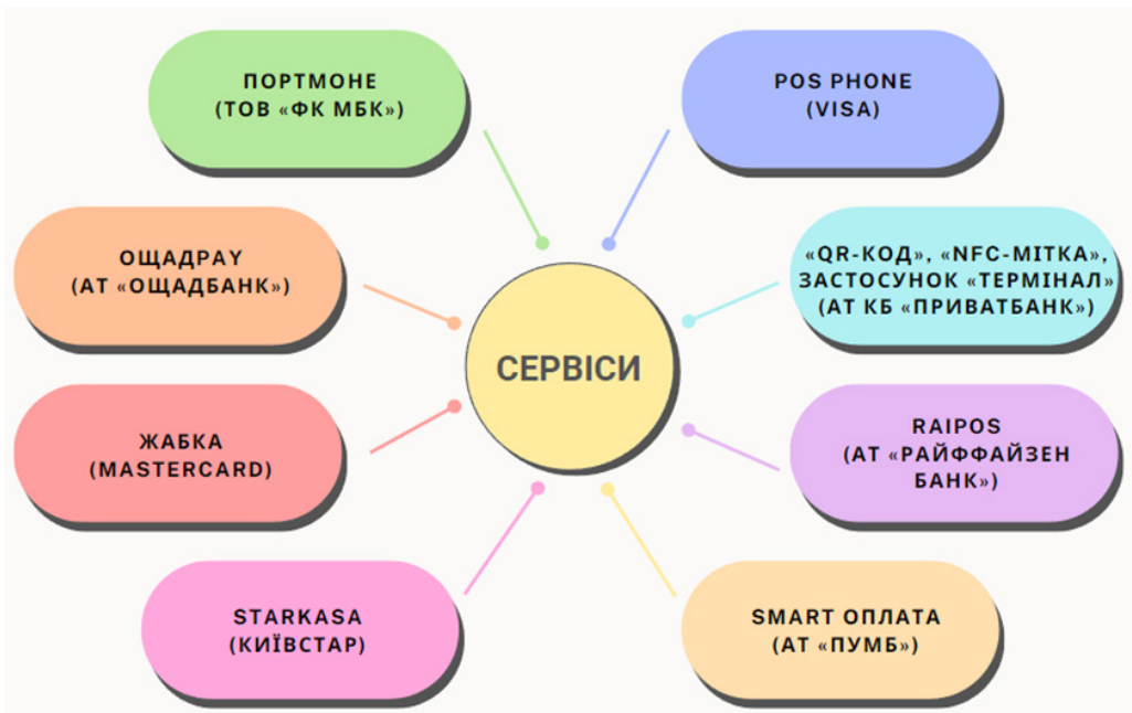
Рис. 2. Технологічні рішення для безготівкових платежів

Для реалізації вищезазначених процесів платіжні системи та небанківські фінансові установи нині пропонують широкий спектр технологічних рішень, що дозволяють приймати безготівкові платежі з використанням платіжних карток навіть без використання фізичних POS-терміналів. Зокрема, на рис. 2 наведені різні сервіси та їх зв'язок із платіжними системами чи банками, які надають технологічні рішення для безготівкових платежів.