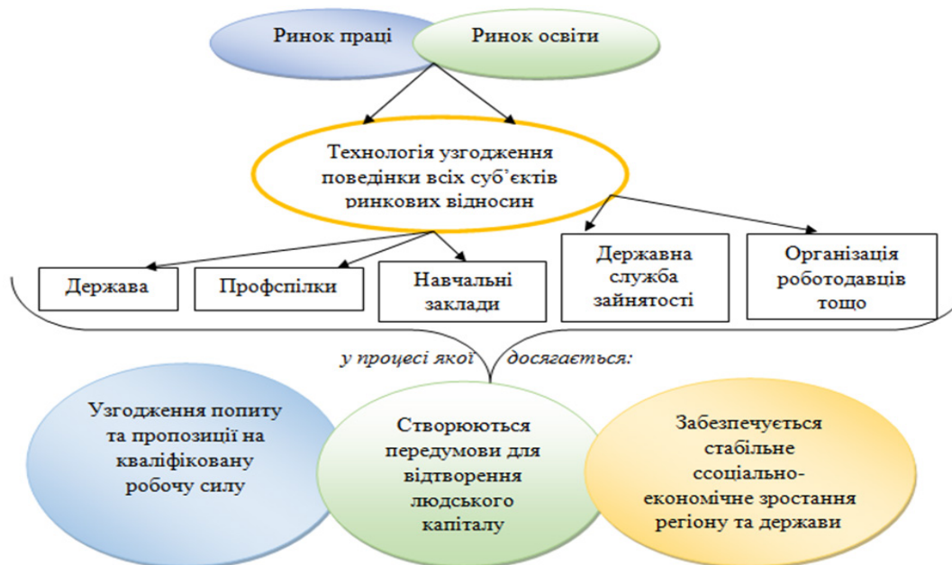
Рис.1 Алгоритм взаємодії молодіжного ринку праці та ринку освітніх послуг

Для цього необхідно залучити до інтерактивного процесу всі зацікавлені сторони: державні установи, роботодавців, профспілки, навчальні заклади, здобувачів освітніх послуг та забезпечити їх діалог між собою, обмін інформацією та досвідом, координацію дій та інтересів. Така взаємодія ринків праці та освіти сприятиме підвищенню якості освітніх послуг, покращенню структури та розподілу талантів, забезпеченню узгодженості між освітньо-професійними характеристиками робочої сили та потребами економіки, рис. 1.