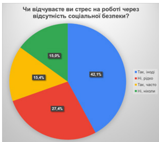
Рис. 3. Чи відчуваєте ви стрес на роботі через відсутність соціальної безпеки?