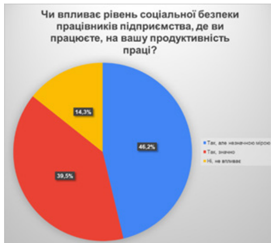
Рис. 4. Вплив рівня соціальної безпеки працівників підприємства, де ви працюєте, на вашу продуктивність праці.