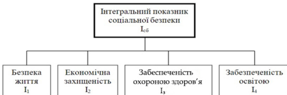
Рис. 1. Складові, які формуватимуть інтегральний показник соціальної безпеки держави

Сучасні аналітики в процесі оцінки економічних аспектів соціальної безпеки активно використовують агреговані показники [9, с. 12]. Наприклад, Н. І. Ставнича [18] пропонує вимірювати соціальну безпеку держави ( I_{сб} ) за допомогою інтегрального показника, що включає чотири складові (індекси): безпеку життя ( I_1 ), економічну захищеність ( I_2 ), забезпеченість охороною здоров'я ( I_3 ) та забезпеченість освітою ( I_4 ) (рис. 1).